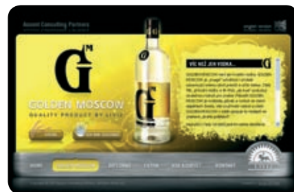
Stránka každého produktu je vždy laděná do pro něj specifické barvy.

Farského 20 326 00 PLZEŇ Česká republika Mobil: +420 603 467 200 Tel.: +420 377 429 851 Fax: +420 377 443 158 Email: info.plzen@destiny.cz